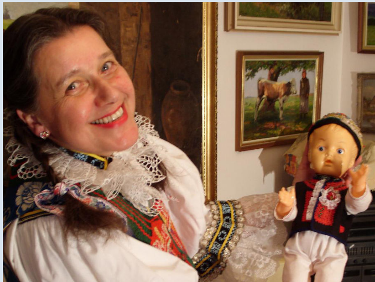
Aktivní sběratelka moravských národních krojů Aktiv samlare av mähriska nationaldräkter